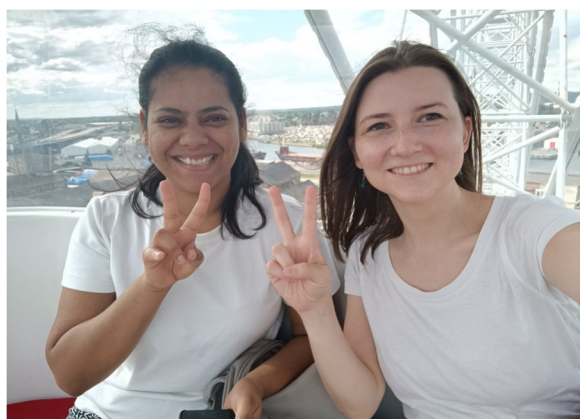
(Mit einer Freundin auf dem Riesenrad in Stettin)

Gerade befinde ich mich für ein paar Tage im Urlaub und bin in Berlin, um Freunde und Bekannte zu besuchen. Am Samstag bin ich bei einer Mini-Freizeit von OM Berlin mit dabei, wir werden am Werbellinsee einen Tag zusammen verbringen. Aktuell befindet sich beim Team in Berlin noch unser Praktikant Tim, der sie dort für sechs Monate unterstützt hat. Ihr dürft gerne für seine Zukunft beten, da er noch nicht genau weiß, wie es für ihn weitergehen soll. Am Sonntag (16.07.) plane ich, den Gottesdienst der EFG Neues Leben zu besuchen. Ich freue mich darauf, euch alle wiederzusehen!